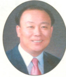
경기도의회 의장 홍 영 기

부처님의 가르침을 바탕으로 온누리를 꿈과 희망이 넘치는 아름다운 정토로 만들기 위해 노력하시는 경기불교문화원에서 「경기불교」 창간호를 발간하게 된 것을 1천만 도민과 함께 진심으로 奉祝드립니다.