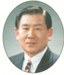
수원시장 김 용 서