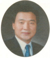
경기도지사 손 학 규