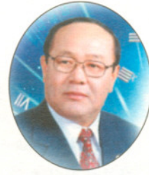
수원시의회의장 김 종 열

지리한 장마 중에 피어난 무지개는 더욱 신선하고 아름답게 보입니다. 미당이 국화를 보고 노래했듯이 무더위와 폭우후에 찾아오는 무지개는 설령 큰 크리이트 담 위에 걸린다 해도 분명 진한 감동을 주는 그 무엇입니다. 반면 오늘날 전세계적으로 만연되고 있는 증오와 폭력은 우리에게 희망을 앗아간지 오래돼 보입니다.